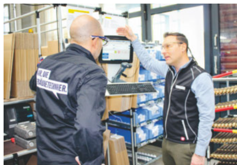
Die massgeschneiderten Bestellungen des Nussbaum-Konfigurators landen direkt aus dem Online-Shop in der Produktion.