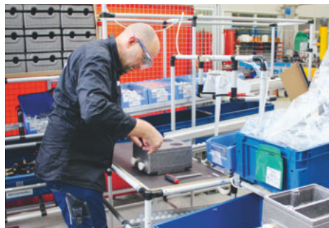
Beim Verpacken der UP-Boxen-Bestellung ist Handarbeit gefragt.