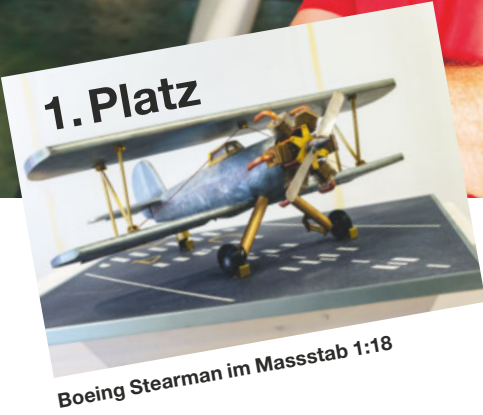
Ivan Obretenov, Sieger Kreativwettbewerb der Spengler 2022